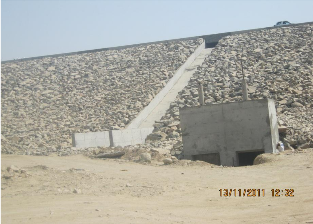
إحدى السدود الكبيرة في وادي قوس