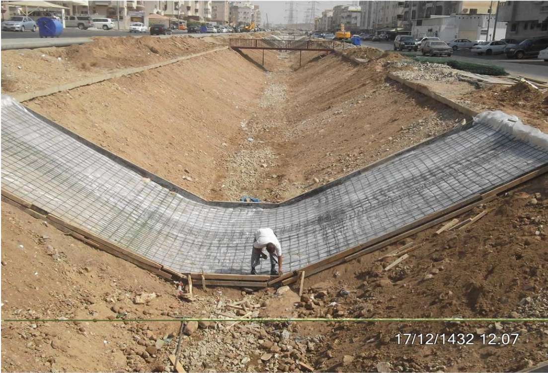
الأعمال الجارية بإحدى القنوات